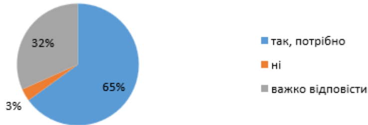
Рис. 2. Відповіді учнів про доцільність проведення фізкультурних свят і змагань

Як бачимо із рис. 2, більшість учнів позитивно ставляться до фізкультурних свят і змагань. Це підтверджує думку багатьох фахівців, що змагальна діяльність є привабливою для школярів.