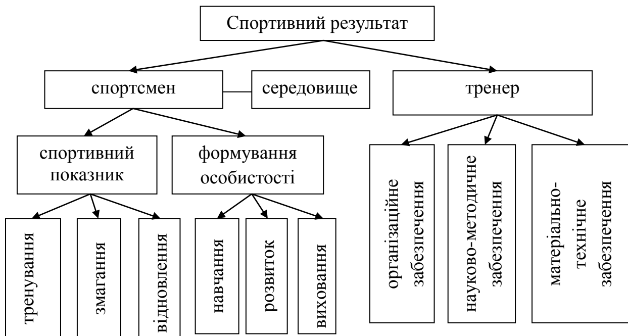
Рис. 1. Система підготовки спортсменів

структура управління, у свою чергу, складається з двох блоків: ведучого (тренера) та забезпечуючого, який включає фахівців різних професій – організаторів, менеджерів, науковців, медиків, психологів, програмістів, інженерно-технічних працівників, господарників, адміністраторів.